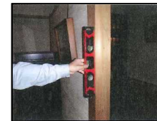
水平器による柱の傾きの計測